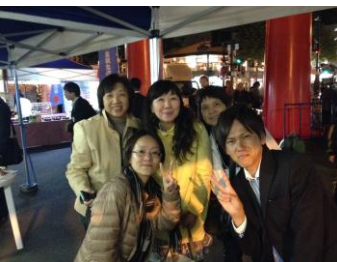
エクスカージョンでは、市内を見学しました！