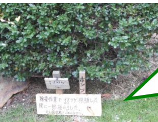
福島市内の除染作業のため、こちらに移植された柘植ですが、少し枯れてしまったそうです・・・