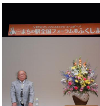
平成25年10月17～19日(木～土)3日間 まちの駅全国フォーラムの様子です。(福島市)

グループ討議では、各課題について、熱心な意見交換が行われました。もう少し話しをしたかったのではないのでしょうか？・・・全国の「まちの駅」も71の地域(ネットワーク)1,602駅になったそうで、さらに地域に根差した“おもてなし”拠点となるよう、地域の特性を活かして、お客様をお迎えしましょう！来年の再会を約束して、散会となりました。皆さん ありがとうございます！