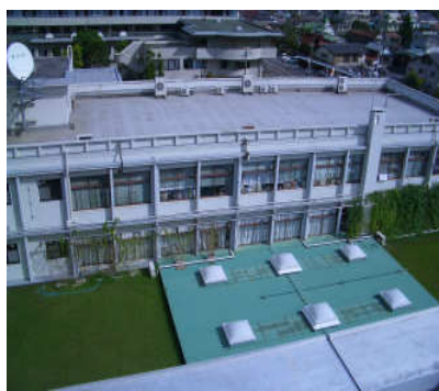
写真：本館・市民ホール

また、庁舎の建設にあたっては、各個別の施設計画において、市民協働の視点に立ち、市民の「力」を導入しながら、推進することが求められている。