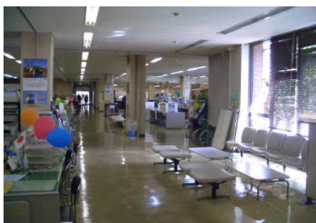
写真：通路に設置された待合