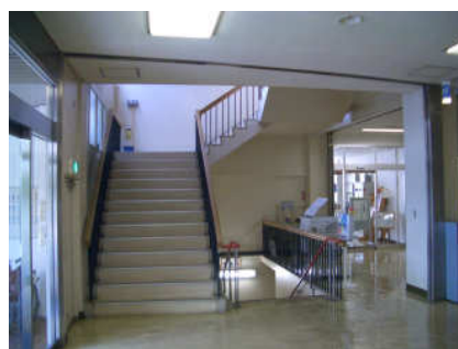
写真：本館ロビーの階段