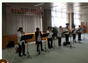
実演「オカリナ吹奏」