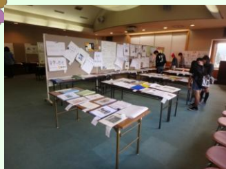
図書館 展示「鹿沼市社会科展」