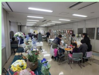
展示・体験の様子

日頃の学びの成果を発表する晴れの舞台「かぬま学びフェスティバル 2016」が、10月15日(土)・16日(日)の2日間にわたり、市民情報センター・文化活動交流館・図書館・川上澄生美術館で開催されました。このイベントは、かぬま生涯学習大学の講座やサークル活動等で学ぶ方々が、ステージでの実演や作品の展示、体験コーナーや模擬店を通じて、日頃の学習の成果を多くの人に知ってもらおうというねらいのもと、平成18年から毎年この時期に開催されています。