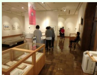
川上澄生美術館 この日は中学生以下の子 ども同伴で入場料が無料

大盛況のうちに幕を閉じた「かぬま学びフェスティバル2016」。多くの来場者は、たくさんの“学び”から熱意と面白さを感じたのではないのでしょうか。新たに学びを始めるきっかけとなった方も多いかもかもしれません。