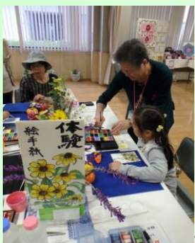
体験「すこやか絵手紙」