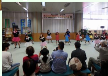
実演「初めてのミュージカル」

2日間とも天候に恵まれ、会場は多くの参加者でにぎわっていました。特に、市民情報センター1階の実演ステージ前には、ダンスやミュージカル、楽器の演奏などを見るために多くの人が集まっていました。その他各フロアにおいても、展示作品の絵画や川柳などを鑑賞する方や、体験コーナーの絵手紙などに挑戦している方がみられました。屋外では、この日のために腕を磨いてきたグループが、焼きそばやスムージーなどを販売していて、美味しそうな香りと彩りが来場者を引きつけていました。また、文化活動交流館にて「太陽の観察」、川上澄生美術館で「木版画刷り体験」、図書館では「市内小中学生による社会科作品の展示」を実施していたりと、会場一帯はたくさんの“学び”に溢れていて、多くの方があちこちを行き来しながら感心する様子が見られました。