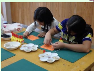
文化活動交流館 体験「星砂で星座絵工作」