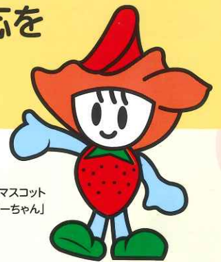
鹿沼市マスコット 「ペリーちゃん」

認知症になっても、できる限り住み慣れた地域のよい環境で 暮らし続けられるために、認知症の人や家族に早期に関わる 「認知症初期集中支援チーム」を設置しました。