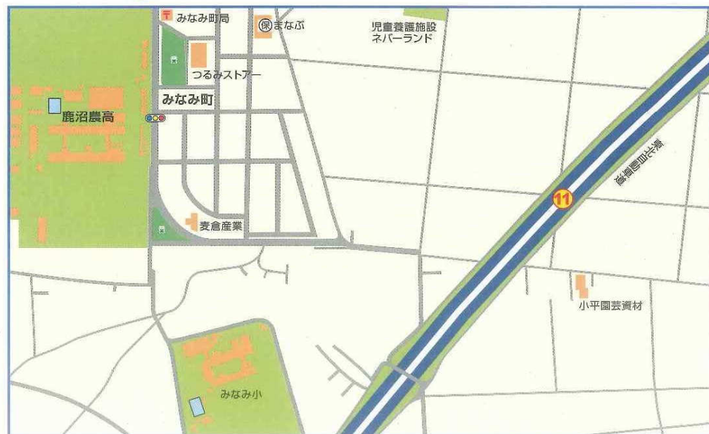
⑪ 下奈良部町 みなみ町団地東高速道路ガード下