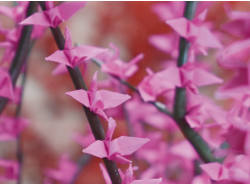
▲葉は折り鶴でできています。