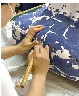
文化財修理の様子