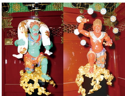
日光山輪王寺大猷院二天門 風神雷神複製像