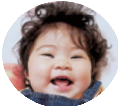
下粕尾 小太刀 白ちゃん (H30.9.12生)