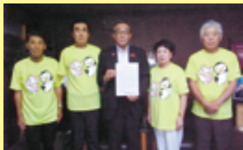
▲メッセージ伝達式

また、3日と10日には、市内中学校で、この運動の輪を広めることを目的とした啓発活動を行いました。