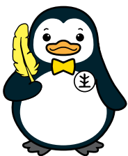
更生ペンギンの ホゴちゃん 更生保護イメージ キャラクター