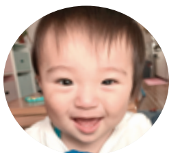
上野町 臼井 徠空 れあと 登くん (H30.8.30生)