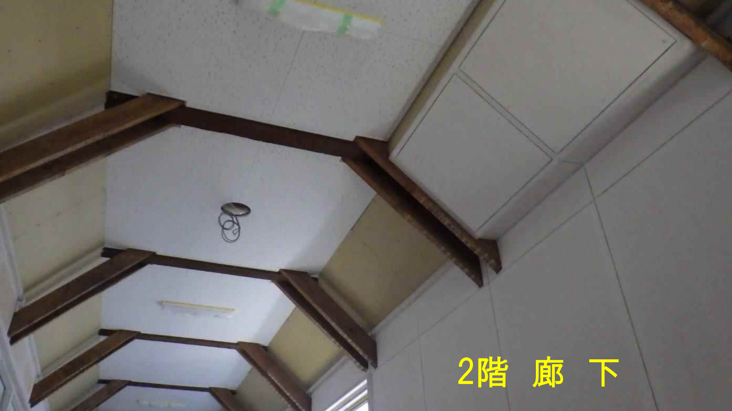
2階 廊 下