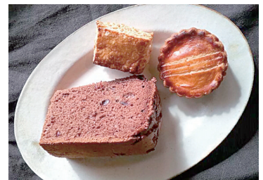
▲左からシフォンケーキ、スコーン、ガトーバスク。

モットーは「みんなが笑顔になれるようなお菓子を作る」こと。東京での移住イベントや市内外の催しにも積極的に参加・出店しています。