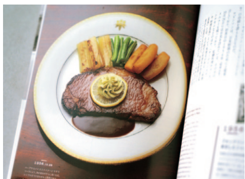
▲「日光100年洋食の旅」(エフジー武蔵・2014年刊)の写真も手掛けました。

東京都墨田区出身。写真専門学校を卒業後、都内を中心にフリーカメラマンとして活動。日光市を経て2年前から鹿沼に在住。現在は日光市内ホテルの広報の仕事やカメラマンとしての活動を幅広く展開している。