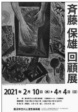
斉藤保雄 回顧展 ポスター▶