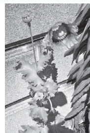
▲ソムニフェルム種

けしには、法律で栽培が禁止されているものがあります。中でもソムニフェルム種は繁殖力が強く、風に乗って種が拡散し、自生することがあります。庭等に自生した場合は、処分してください。また、不正けしを見掛けたり、鑑別に迷ったりしたときはご連絡ください。