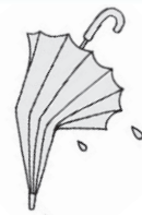
▲布の部分を剥がしてください。