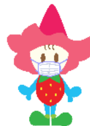
小苺 ベリーちゃん