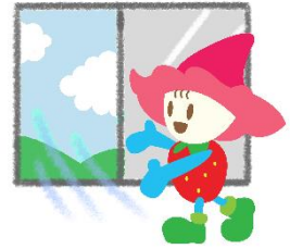
小苺 ベリーちゃん