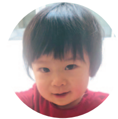
花岡町 高 ひびと 山 と 陽 ひ 日 び 人 と くん (R2.4.23生)