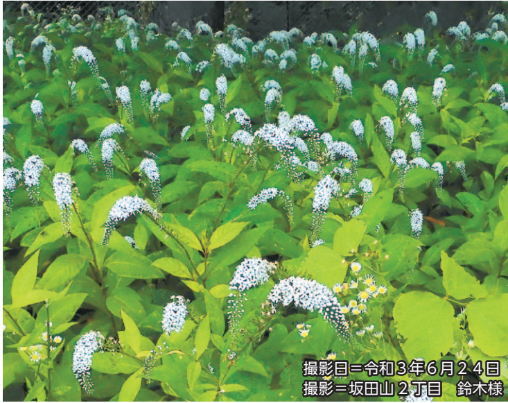
撮影日=令和3年6月24日