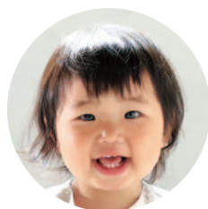
上石川 江 めい 侯 い 芽 め 依 い ちゃん (R2.4.7生)