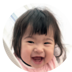
千手町 千代川 こころ こ こ ろ ろ ちゃん (R2.4.8生)