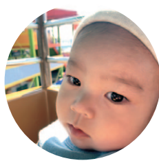
千渡 染宮 ひなた 陽 ひな 太 た くん (R2.4.15生)