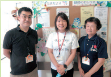
▲ 高齢者支援センター北の職員の皆さん。

高齢者支援センターについて、菊沢地区と板荷地区を担当する高齢者支援センター北の職員の皆さんにお話を聞きました。