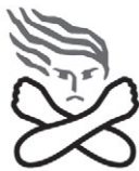
▲女性に対する「暴力根絶」のシンボルマーク