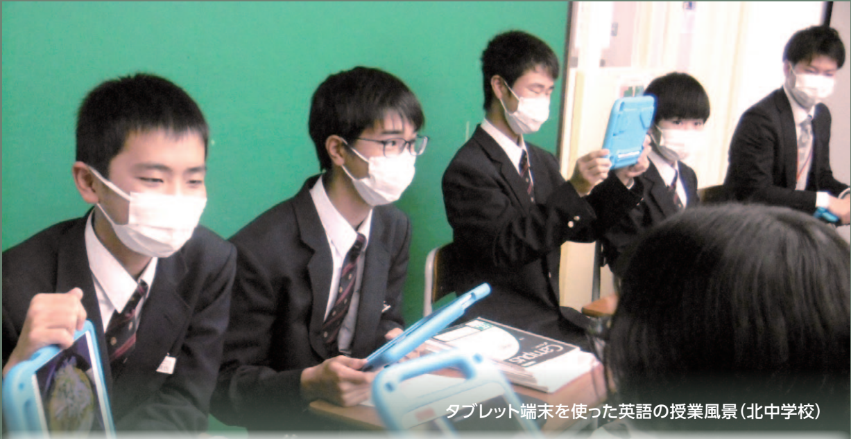
タブレット端末を使った英語の授業風景(北中学校)

本市では、小中学生に新しい時代に必要とされる資質・能力を育成するために、新学習指導要領で示された「主体的・対話的で深い学び」の実現に向けた授業改善に取り組んでいます。