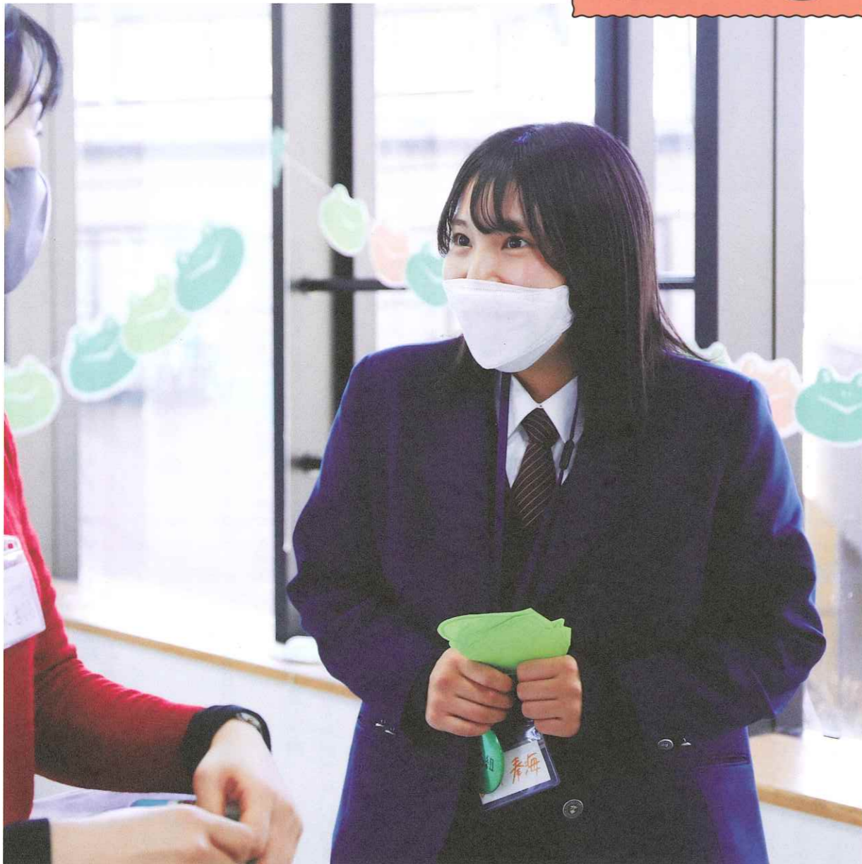
発表会にてゲストからコメントをもらう様子、ルンルン🌈

ISSUE 今月の記事◎第3回かえる組/鹿沼の未来を伝える/発表準備大変/畜産部の1日/活動を見守る地域の大人たち③/これからの若頭/鮭