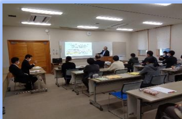
〈教職員対象の研修会〉

令和4年度「コミュニティ・スクール」導入校は、みどりが丘小・菊沢東小・菊沢西小・池ノ森小・加園小・板荷小・加蘇中・板荷中です。その他の学校は、令和5年度に導入予定です。