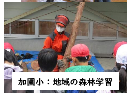
加園小：地域の森林学習