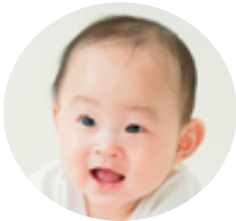
幸町1丁目 白井 道縁くん (R3.3.30生)