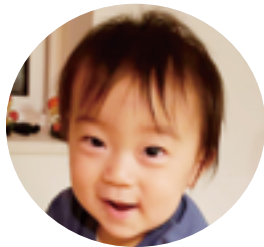
坂田山 阿部 智明くん (R3.4.15生)