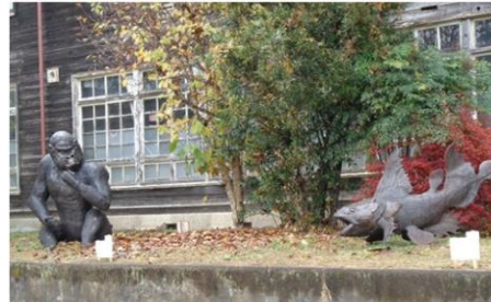
旧栗野中で作品展示