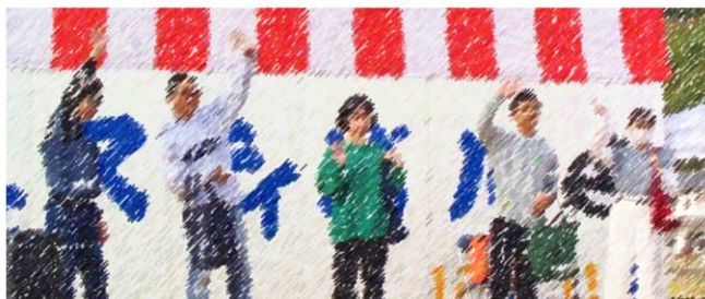
なんまんバッグのファッションショー