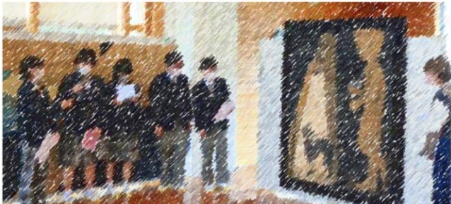
作家をお呼びしての鑑賞授業(栗野中オープンスクール)