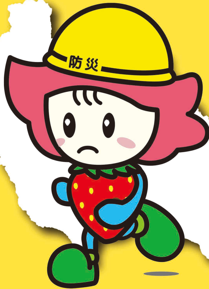
鹿沼市のシンボルキャラクター 「ベリーちゃん」