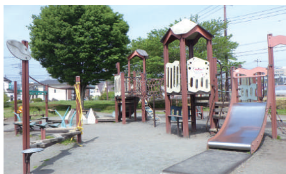
▲複合遊具 アスレチックやすべり台など楽しめます。