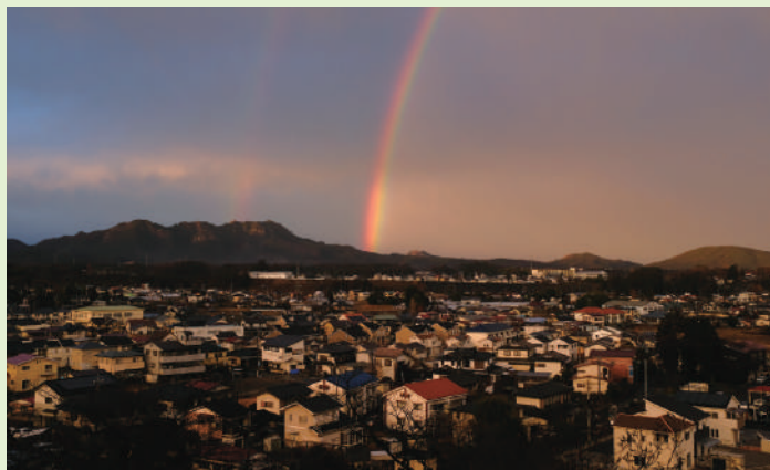
▲千手山公園からの景色 運が良ければこんな景色が見られるかもしれません。

1回50円で、「観覧車」、「おとぎ電車」、「ジェットスター」の遊具に乗ることができます。「千手院」があり、楽しさだけでなく歴史も感じられる公園となっています。