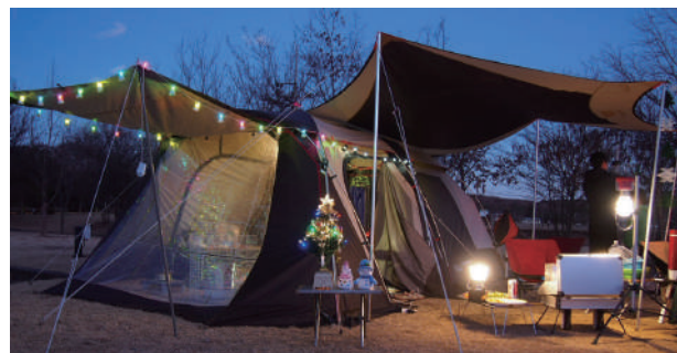
▲キャンプ場 親子連れに好評です。