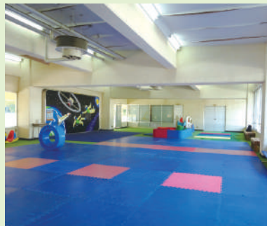
◀屋内遊び場 (トレーニング室) 雨を気にせず遊べます。