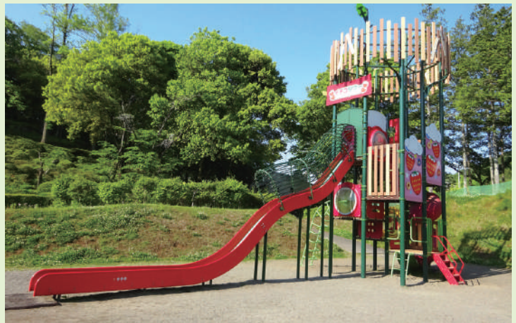
▲「いちごタワー」 小さなお子さんに 人気です。

また、散策路での森林浴や、桜・紅葉を見ながらの散策もおすすめで、幅広い年齢の人がくつろぐことができる公園です。