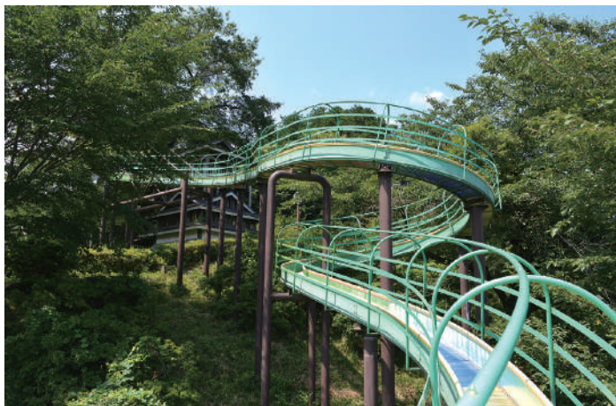
▲「スカイローラー」 子どもたちに大人気のすべり台です。

園内には、広々としたウォーキングロードがあり、四季折々の自然を感じながら園内散策ができます。アスレチックもあり、たくさん遊んだあとは、ベンチで一息ついてリラックスしてみませんか？