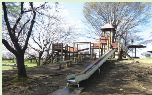
▲複合遊具 奥にはロープウェイもあります。