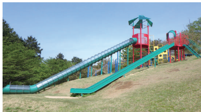
▲「いちごすべり台」 富士山の中腹にあり、見晴らしもよいです。

また、頂上へ向かう坂の途中には、傾斜を利用した大きな「いちごすべり台」が2基あります。その他にもブランコなどの遊具もあるため、小さいお子さんから遊ぶことができ、楽しめるスポットになっています。