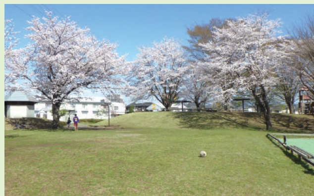
▲芝生広場 ピクニックに最適です。