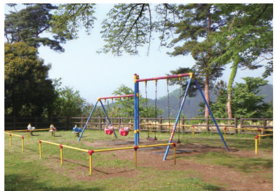
▲富士山頂上の遊具 頂上から鹿沼市が一望できます。