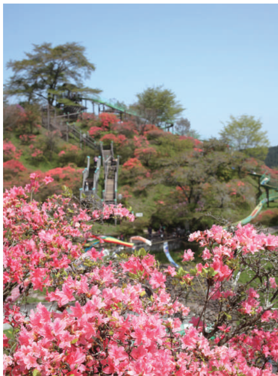
▲つつじ 4月～5月が見頃です。