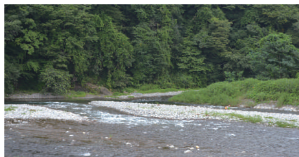
▲大芦川 清流沿いを歩くことができます。

また、トイレや洗い場が整備されており、バーベキューなどができるデイキャンプエリアもあります。管理棟には売店があり、調味料などの購入や、アウトドア用品のレンタルができます。ルールやマナーを守りながら、普段とは異なる時間の流れをこの公園で楽しんでみませんか。