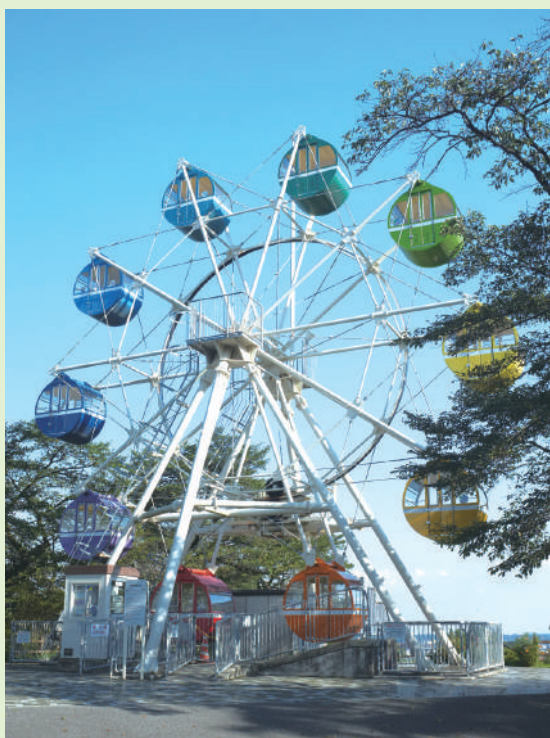
▲「観覧車」 1回50円で乗ることができます。

鹿沼を眺望でき、園内散策が楽しめます。「恋空」という映画のロケ地にもなり、聖地巡礼で訪れる人もいます。