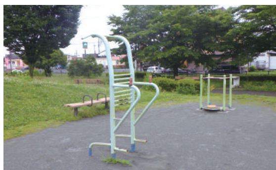
▲健康遊具 公園散策前のストレッチにも最適です。