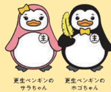
更生保護 イメージキャラクター

犯罪や非行をした人達からの相談に乗ったり、助言を行うほか、それぞれの地域で犯罪や非行をした人の立ち直りや犯罪予防のための啓発活動を行っています。