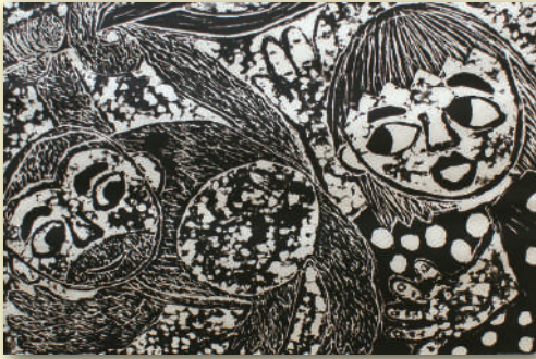
《木のぼりじょうずなおさるさん》