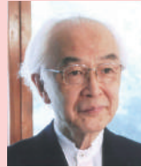
柳田 邦男 ノンフィクション作家、評論家