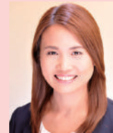
平野 早矢香 スポーツコメンテーター、 解説者