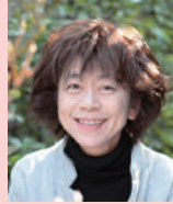
いせ ひでこ 絵本作家、画家