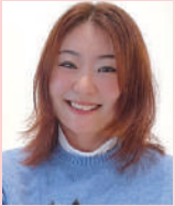
藤田 さいき プロゴルファー