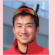
渡辺 一馬 プロライダー