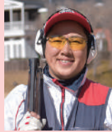
石原 奈央子 プロクレー射撃選手