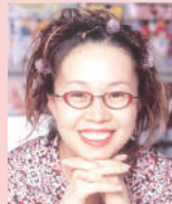
高口 里純 漫画家、小説家、 イラストレーター、作詞家