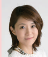
古沢 知子 アナウンサー