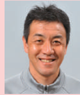
黒崎 久志 プロサッカーコーチ、 元プロサッカー選手