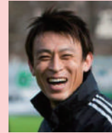
和久井 秀俊 プロサッカー選手