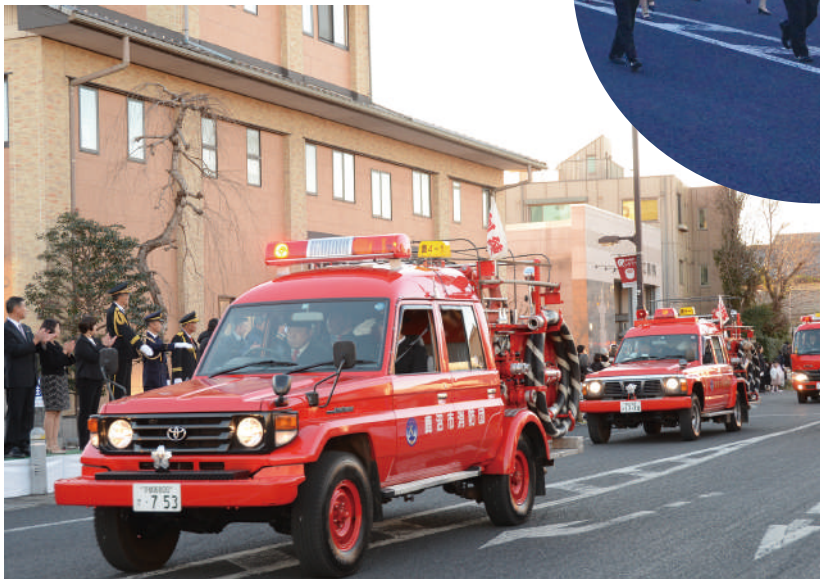
▲令和6年消防出初式分列行進の様子（古峰ヶ原宮通りにて）

消防団員は、普段は自営業やサラリーマン、学生などそれぞれの仕事をしながら地域を守る、最も身近な防災リーダーです。火災をはじめ、自然災害や地震にも対応するほか、災害が起きないよう、防火防災活動も行っています。