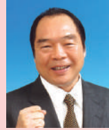
ガッツ石松 タレント、 元プロボクサー