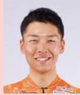
小野寺 玲 プロサイクル ロードレーサー