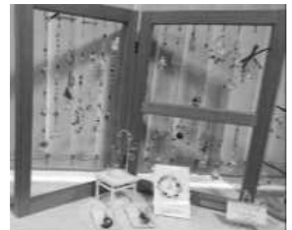
↑ サンキャッチャー & アクセサリー作り

実演ステージでは、フラダンス・ヒップホップ・オカリナ・ギターなどの色々な発表があり、会場を盛り上げていました。子どもたちの発表では、客席にいる保護者の方々から我が子を見守る思いが伝わってきました。