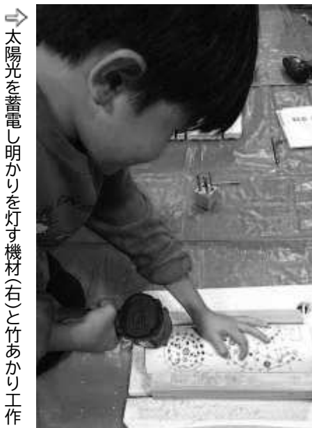
⇒ 太陽光を蓄電し明かりを灯す機材(右)と竹あかり工作

鹿沼自然エネルギー推進会では、太陽光発電機の展示と体験コーナーに多くの方が集まっていました。温暖化防止に向けて自然エネルギーの働きを知り、環境を守ることを目的としているそうです。太陽光を蓄電した電池で明かりを