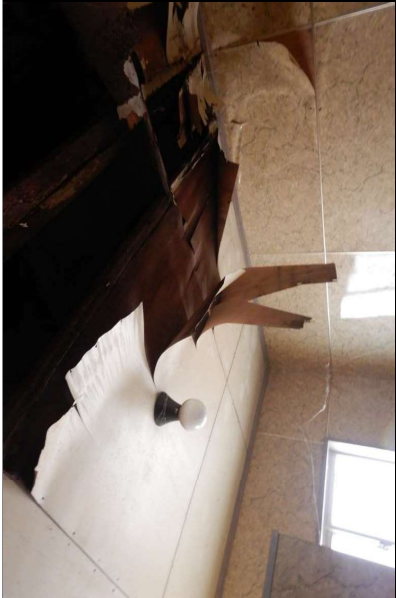
No.11 1階 女子便所 天井(プリント合板) (劣化状況写真)