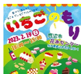
例) イベント 「いちごのもり」

市は「いちご市」を宣言し、知名度向上のために様々な事業を通して、市内はもとより全国に「いちご市」をアピールしています。特にシティプロモーション事業において積極的に連携のお声掛けいたします。