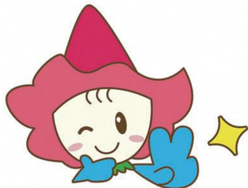
鹿沼市シンボルキャラクター「ベリーちゃん」