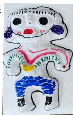
土偶ミニレプリカ